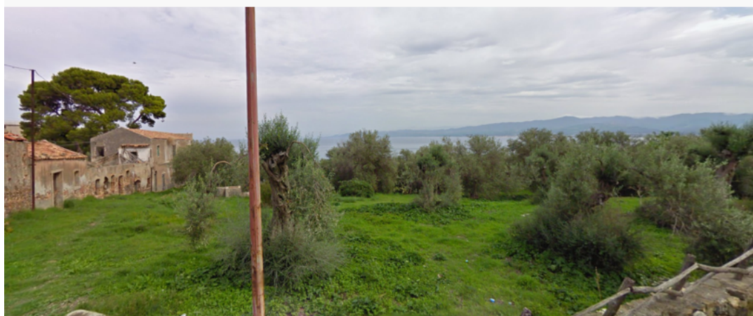
Terreno sfitto in località Bevaceto